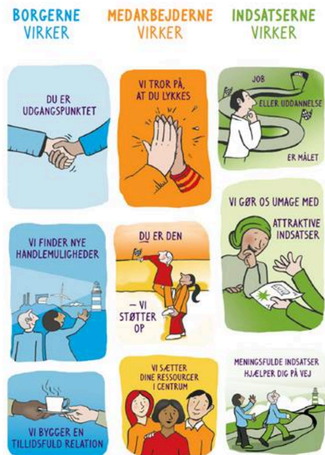
Figur 1: Pejlemærkerne i ARI

Pejlemærkerne er essensen af, hvordan ARI arbejder, og hvorfor: